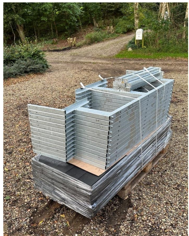
borde-bænkesæt klar til at blive samlet

Der er nyt omkring Blue Walk, og nye kontaktpersoner hvis du skal have fat i en fra vandværket.